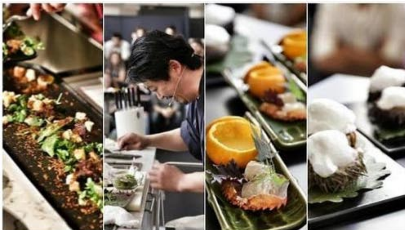
Imágenes del Festival de Peixe en Lisboa

Los restaurantes de Lisboa mejoran cada año. Recorremos los nuevos y los clásicos. Buenas direcciones para el próximo viaje